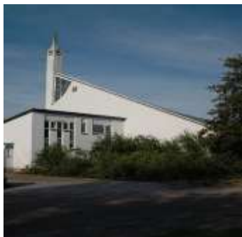
Achterkant Moeder Gods kerk

De dagelijkse gang van zaken was in handen van de Parochiekerncommissie (PKC) Moeder Gods