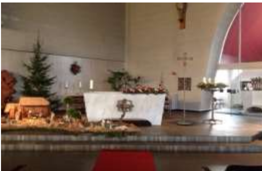
Kerstgroep vml. Goede Herderkerk