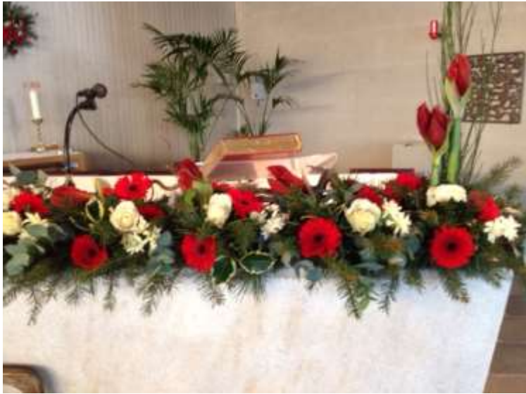
Wekelijks fraai verzorgde bloemversiering met veel extra's bij de Hoogfeestdagen