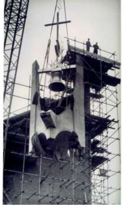
1966 – 1967 bouw van de kerk onder architectuur van Ir. Antoon van Kranendonk