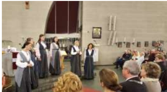
Latvian Voices uit Riga (Letland)