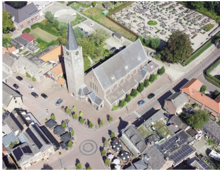
> De Nispense kerk als multifunctioneel centrum.

Fakton kregen we een overzicht van de verschillende mogelijke scenario's gebaseerd op een vergelijking "appels met appels". Dit alles heeft de wethouder en de brede werkgroep op 12 december 2023 doen besluiten om de keuze te maken voor het "versoberd plan", wat we als Dorpshuis Nisipa hebben ingebracht.