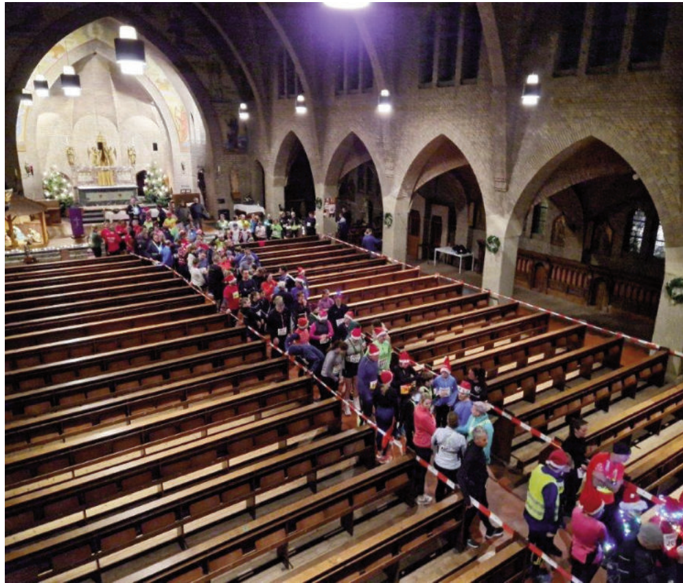
> Hoe de Nispense kerk ook op andere manieren mensen verbindt...

wedstrijden wisten we dat er al een record aantal deelnemers zouden starten. We moesten al snel reserve nummers gaan inzetten omdat we ruim