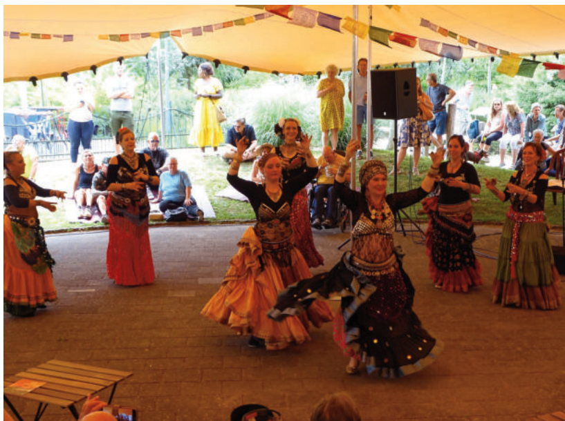
> De Exotische Markt met muziek, dans en lekker eten.

Dan is het zaterdag 29 juni tijd voor het voorproefje van de Exotische Markt; op deze dag zijn er 3 gratis workshops; er wordt gestart met Qi Qong, hierna Mantra zingen en we sluiten af met 1 uur heerlijk Afrikaanse dans.