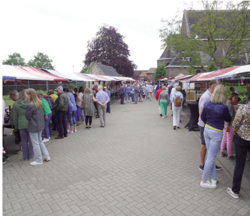
> Gezellige sfeer en creativiteit op de Kunstmarkt Nispen.