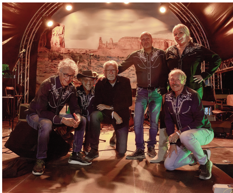
> The Rivals Band brengt Nispen in een countrysfeer.

bezoekers van het Openluchttheater van muziek voorzien.