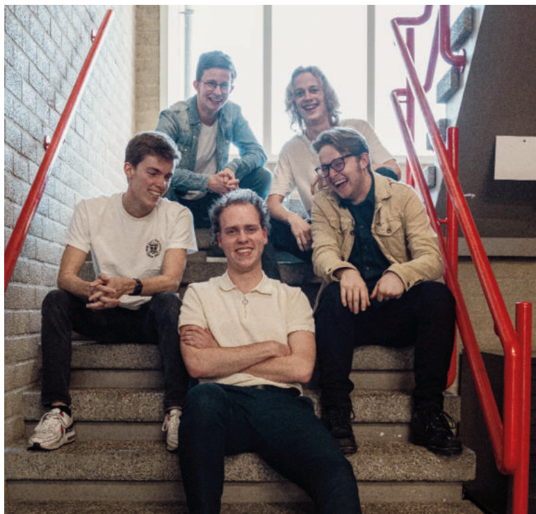
> De Roosendaalse Comedy-Club: 'Over the Punchline'

Daarnaast graag extra aandacht voor zaterdag 29 juni: Deze middag is er de aanloop naar de Exotische Markt; deze