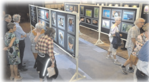
Foto Groep Nispen organiseert een expositie in Basisschool De Linde, ingang via de achterzijde bij het Openluchttheater, volg de borden.

Te bezoeken van 10.00u – 17.00u. Entree gratis.