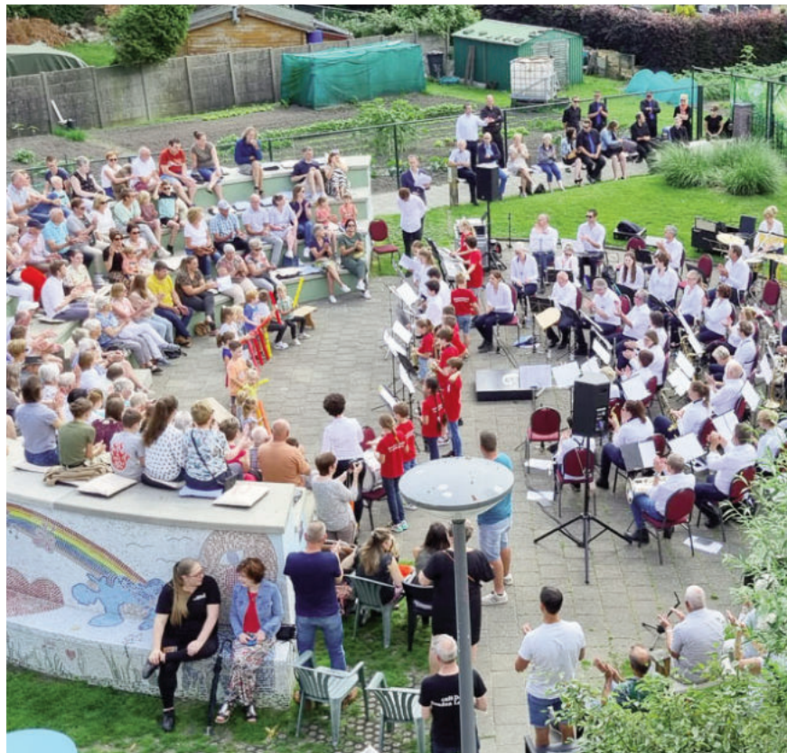
> ‘Laat de muziek in je hart’ in het Openluchttheater Nispen.

op dinsdagavond 2 juli in het openluchttheater, aanvang 20.00 uur.