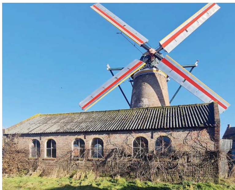
> Het motorhuis van de Nispense molen anno 2024.

vanuit toeristisch-recreatief oogpunt weer aantrekkelijker. En dat komt ook ten goede aan andere partijen in ons dorp zoals de horeca en winkels.