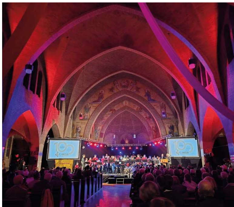
> Nispense kerk tijdens het jubileum van de Harmonie.

blijven wonen. Binding met Nispen blijft hierbij een vereiste.